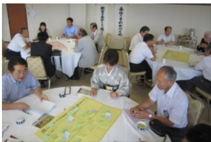
意見を付箋に記入し模造紙に貼る様子