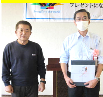
幸道 森市 会員 (右)