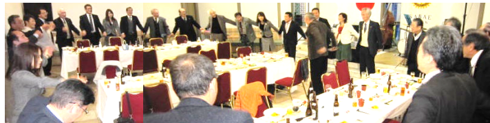
参加者で「手に手つないで」