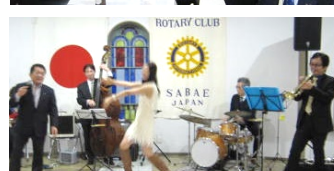
会場を盛り上げるジャズ生演奏