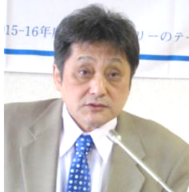
青少年奉仕委員会<RAC・RYLA>