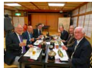
5班の皆様 なんと!お歴々揃い