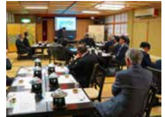
RACの活動報告等発表

やる気のある18～30歳の人達が集まるローターアクトでは、ローターアクト会員(通称「ローターアクター」)がリーダーシップや職業スキルを磨き、ロータリー会員等地域のリーダーと交わり、楽しみながらボランティア活動をする。地元や世界の問題などについて考え、画期的な解決策を見出すなど、ローターアクターはグローバルに活躍するもの