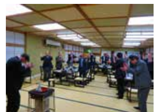
一発締め いよ～! パン!