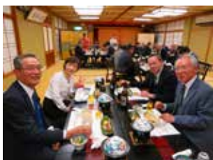
1班の皆様 笑顔でピース♡