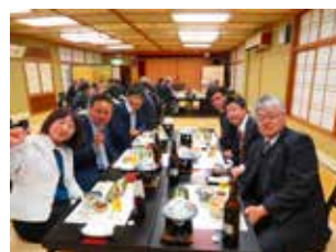
2班の皆様 べりーぐっど!!