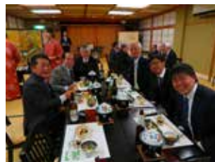
3班の皆様 楽しく飲んでますか～～