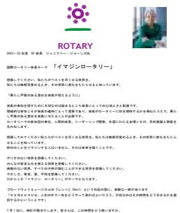
2021-2022年度 国際ロータリーテーマ 「イマジンロータリー」

次年度のクラブテーマは、「わくわくと感動と思いやりを持って奉仕しよう」を考えております。どうかクラブ運営、活動に対しまして皆様方のご協力とご理解をお願いいたします。会長の時間とさせていただきます。