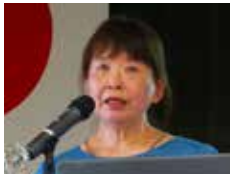
卓話: 原発のごみ処分を考える会

県環境アドバイザーと地球温暖化防止活動推進員。平成14年より、地域の小学生対象に環境学習体験活動「土曜塾」を主宰。令和元年より、「(一社)さばえ文化振興事業団」代表理事です。拍手でお迎ください。